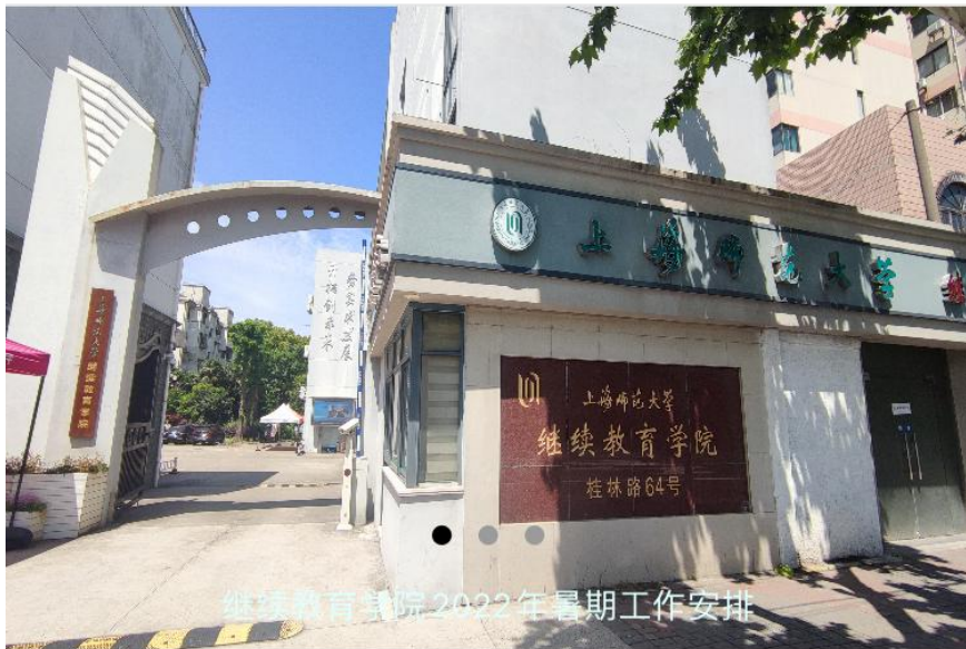
继续教育学院2022年暑期工作安排